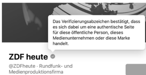
Abb. 2: Hintergrundinformationen zum Verifikationshinweis