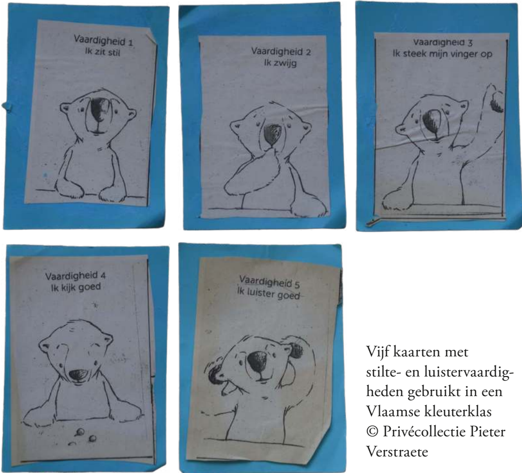
Vijf kaarten met stilte- en luistervaardigheden gebruikt in een Vlaamse kleuterklas

een tiental minuutjes kunnen terugtrekken. De materiële aanpassingen van de klasomgeving leiden tot betere concentratie en gedrag, bieden de kinderen rust, en stimuleren de verantwoordelijkheid én de zelf-bewust-wording van kinderen. In een wereld waarin alles continu moet worden opgeladen – denk maar aan gsm's, smartwatches of elektrische auto's – heeft ook het zich ontwikkelende kind “een oplaadpunt nodig voor zichzelf”. 1 Aan de vele prikkels die gedurende een schooldag aan de kinderen worden aangeboden hangt een prijskaartje: de batterij van het zelf raakt op. Die lege toestand van het zelf kan zich op verschillende manieren manifesteren. Zo zijn er kinderen die vermoeid raken, beginnen te geeuwen of minder alert worden. Maar evengoed zijn er leerlingen die beginnen te razen of andere kinderen pijn doen. Beide manifestaties zijn het gevolg van dezelfde oorzaak: het zelf raakt op en moet worden heropgeladen tot het opnieuw zijn oorspronkelijke honderd procent heeft bereikt.