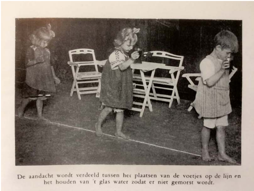
Een oefening in concentratie en het controleren van de beweeglijkheid

uitmonden in een verfijning van het gedrag van het kind. “Nu, de gevolgen van deze stilte zijn erg interessant: kinderen worden erg GEVOELIG voor GELUID ... gevoeliger worden, weten jullie wat dat betekent? Dit betekent dat de geluiden LUIDER lijken ... Als je de gevoeligheid voor geluid combineert met de liefde voor stilte, zal je zien wat alle mensen zeggen, dat met deze oefening de school meer gedisciplineerd en rustiger wordt.” 45 Om haar punt verder toe te lichten geeft Montessori het voorbeeld van kinderen die iets op de grond willen zetten en door hun liefde voor stilte dit op een zo onhoorbare manier proberen te doen.