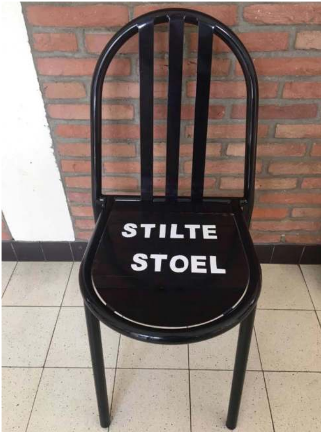
Een stiltestoel in een Vlaamse school voor buitengewoon onderwijs

van verzet of intellectuele tekortkoming geïnterpreteerd. Het feit dat hij zich niet engageerde in de groepswerken en maar heel zelden antwoord gaf op de vragen die hem werden gesteld, kon op weinig sympathie van de Amerikaanse onderwijzers rekenen. Hao's stilte paste niet in het Amerikaanse onderwijsstelsel waar van kinderen verwacht werd dat ze vooral dialogisch leerden en al converserend progressie maakten. Stil zijn stond gelijk aan niet mee willen, dan wel niet mee kunnen, en had dus voornamelijk een negatieve connotatie.