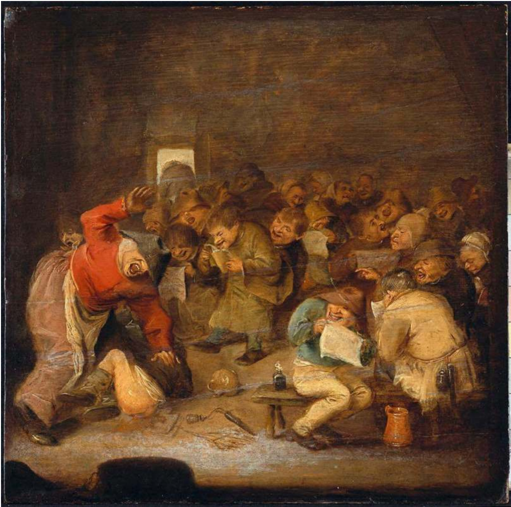
Een school uit de zeventiende eeuw geschilderd door de Vlaamse schilder Adriaen Brouwer

dit gebrek aan aandacht voor de opvoeding en het onderwijs van nieuwe generaties kinderen onlosmakelijk samen met een gebrek aan deugdzaamheid bij volwassenen en de verschrikkelijke gevolgen die hieraan gekoppeld dienden te worden – zoals bijvoorbeeld de vele godsdienstoorlogen die toen woedden. Enkel door kinderen al vanaf jonge leeftijd op te voeden en na verloop van tijd in contact te brengen met wat hij noemde de bonae literae – inspirerende geschriften uit de Grieks-Romeinse oudheid – kon men hen kneden en de juiste vorm geven opdat ze zouden uitstijgen boven het niveau van dierlijke instincten.