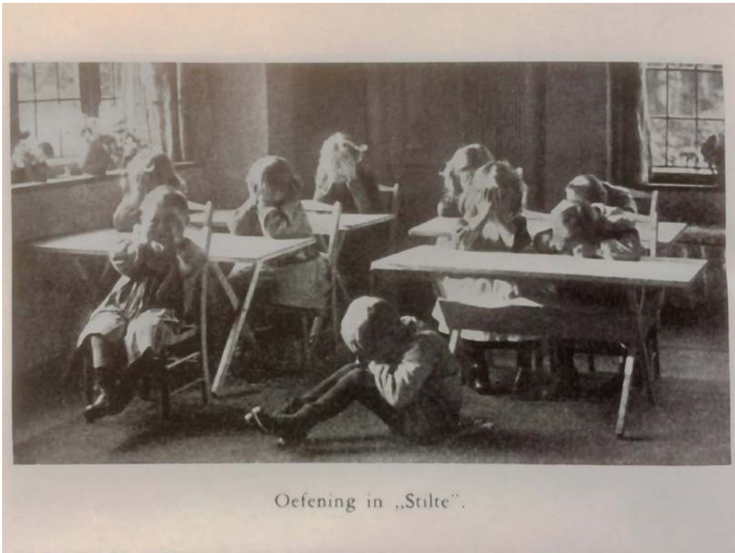
Een oefening in 'stilte' volgens de Montessori Methode 25

deze kunnen jullie niet blijven; – luistert maar eens, of jelui haar ademhaling hoort.” 26 Het resultaat van de aangehouden inspanningen van de kinderen om zich zo stil te houden als de baby, en zo rustig mogelijk adem te halen, was dat de kinderen plots werden blootgesteld aan geluiden die normaal gezien door het normale levensgedruis werden overstemd: het ruisen van de bladeren, het vallen van een druppel water, en het tikken van een klok. 27 Het ontsluiten van deze geluiden zag Montessori als een belangrijke prikkel die de kinderen gevoelig zou maken voor het belang van activiteit, want het was het actieve onderdrukken van beweging en geluid dat ervoor zorgde dat zich een nieuwe wereld opende. Voor Montessori was deze verruiming van de wereld een cruciale voorwaarde voor het welslagen van elke hervorming op het gebied van opvoeding en onderwijs; 28 een verruiming die in schril contrast stond met de continue pogingen van ouderwetse onderwijzers die er net op uit waren om de wereld van het kind op allerlei manieren in te perken. 29