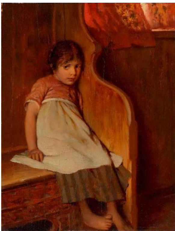
Het verlegen meisje door de Duitse kunstenaar Hermann Kaulbach © Wikimedia Commons

Wie in het onderwijs staat, kinderen heeft of de kinderen van zijn of haar broer of zus heeft bestudeerd wanneer ze op twee- of driejarige leeftijd op een feestje toekomen, die zal ze ongetwijfeld kennen: de kleuters en peuters die zich dralend aan de rok of broek van mama of papa vastklampen, de kinderen die schoorvoetend, met bevende handen en een lichte krak in de stem vooraan in de klas een versje opzeggen, of de jongeren die liever de kat uit de