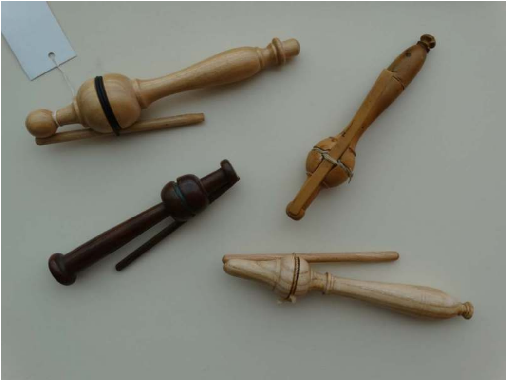
De knip of le signal van Jean-Baptiste De la Salle

hun boek steeds in de hand houden en goed meedoen; dat hun armen en handen altijd te zien zijn en ze elkander niet aanraken dat ze elkaar niets geven, of naar elkaar kijken; dat ze altijd de voeten netjes naast elkaar geplaatste houden; dat ze nooit de voeten buiten hun schoenen of klompen steken; dat de schrijvers niet op tafel gebogen liggen, terwijl ze hun les opzeggen, en dat ze geen enkele onbetamelijke houding aannemen.” 20