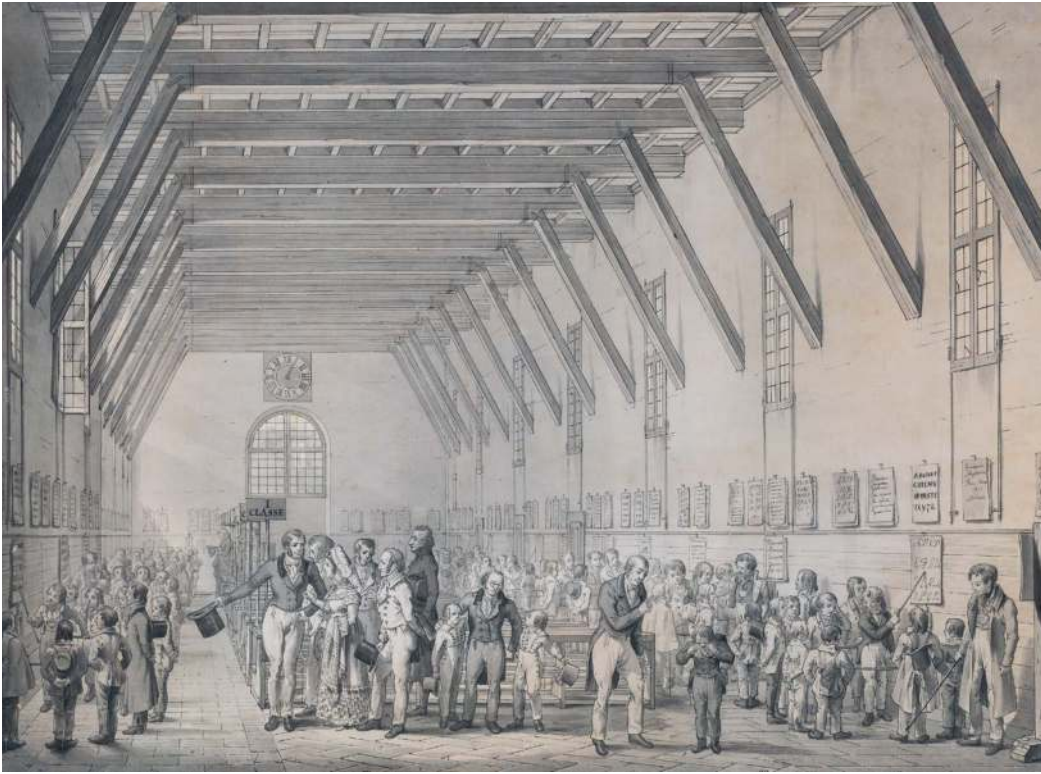
Een aquarel van Het Lancaster-Bell onderwijssysteem door Giovanni Migliara, 1820

pleidooi voor het gebruik van stilte in de pedagogiek terug, maar wordt aandacht besteed aan de politiek-maatschappelijke rol van stilte en het leren stil zijn op school.